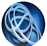
Conectores & Clamps