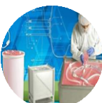
Bolsas para bioprocessos