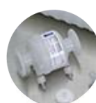
Cartuchos e cápsulas de filtração