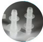
Pure-fit SIB Conexões e junções