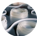
Tubos & Acessórios

A Saint-Gobain, além de tubos, conectores, filtros, bags e manifolds, oferece amplas possibilidades de montagens customizadas, projetadas especialmente para seu processo e produzidas em sala limpa, com todas as certificações exigidas pelo setor e podendo ser fornecidos já esterilizados (gama irradiados).